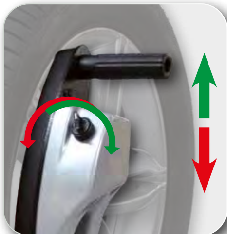
AUTOMATICKÝ - AUTOMATIC